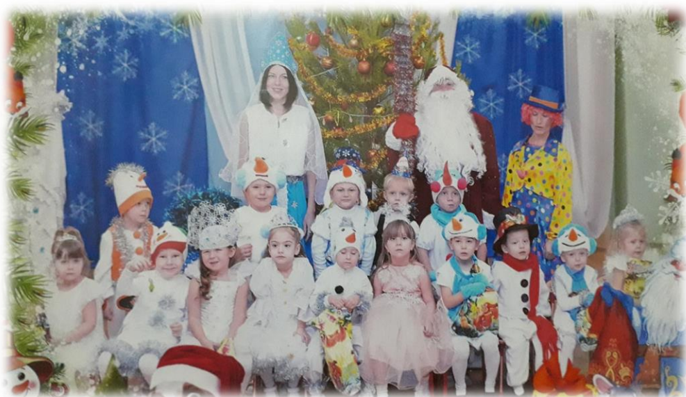
8 марта 2018г.