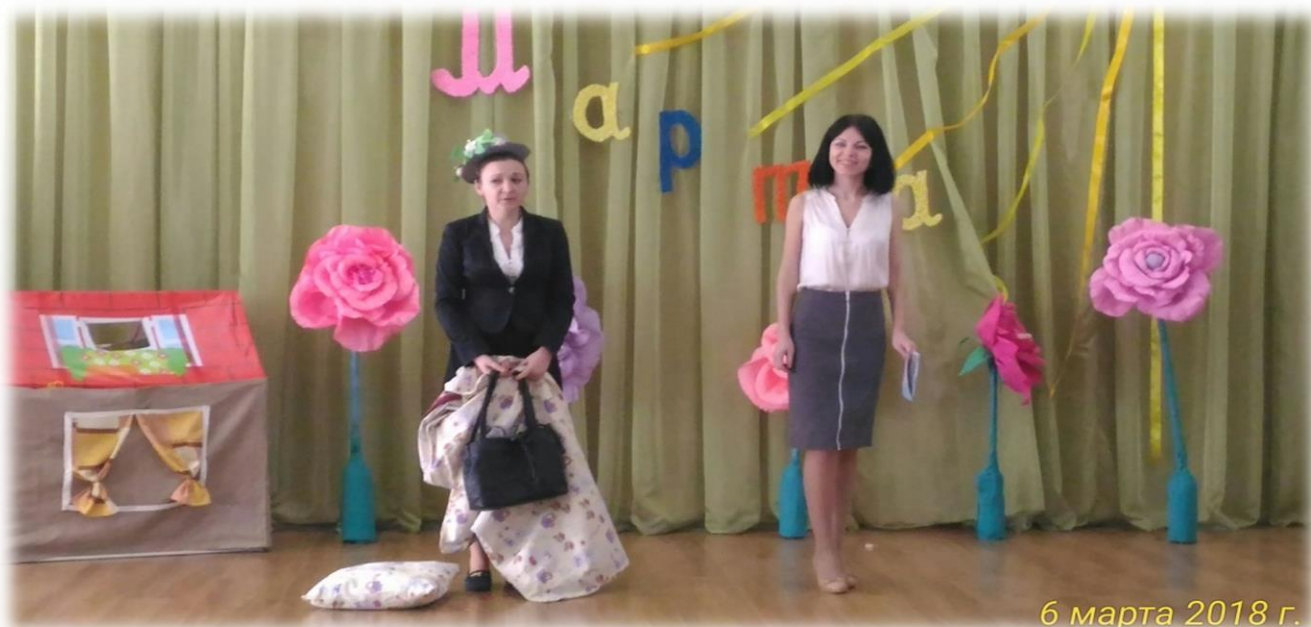
6 марта 2018 г.